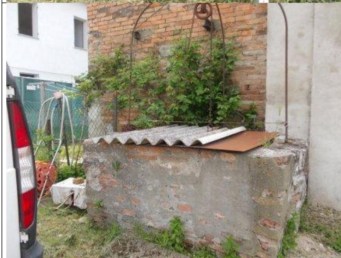
CAV CA 15 (8)