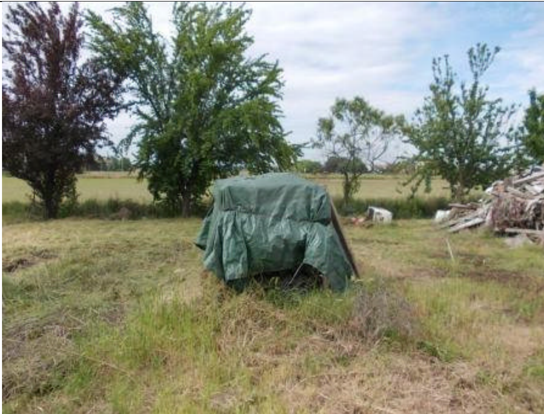
CAV CA 15 (1)