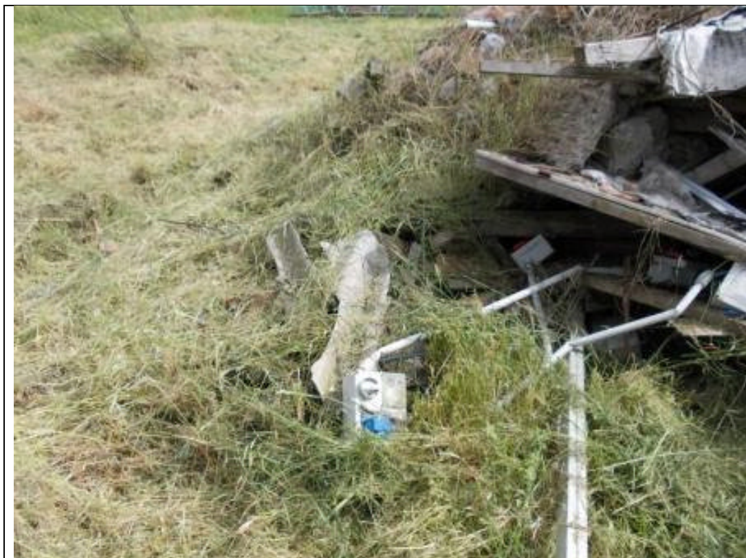
CAV CA 15 (7)