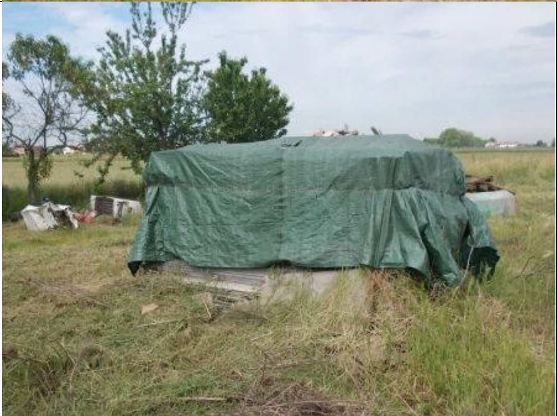
CAV CA 15 (2)